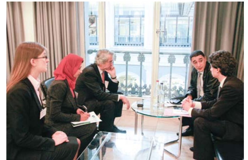
EMA im Dienst der deutsch-marokkanischen Entwicklungszusammenarbeit: Vertreter des Wasserversorgers ONEP im Austausch mit Hamburg Wasser auf dem EMA Wasserforum 2010

Probleme bei der Durchführung der entwicklungsbezogenen Projekte sind sowohl im Aufnahme- als auch im Herkunftsland – also sowohl in Deutschland als auch in Marokko – zu finden. Es fällt auf, dass die Hauptprobleme bei der Durchführung von entwicklungsbezogenen Projekten nach Ansicht der befragten Netzwerkmitglieder in Marokko liegen. So gaben fast zwei Drittel der Befragten an, dass sie ihre Projekte nicht erfolgreich umsetzen konnten, weil in Marokko keine kompetenten Ansprechpartner zur Verfügung standen. Fast die Hälfte aller Befragten sieht ein großes Problem im mangelnden Interesse auf marokkanischer Seite. Weitere Schwierigkeiten entstanden beim Transfer von Hilfsmitteln und Gütern von Deutschland nach Marokko. Fast zwei Fünftel der Befragten wertet den Mangel an finanziellen Mitteln und ein Viertel die fehlende Mobilisierbarkeit von marokkanischen Migranten in Deutschland als ein Problem.