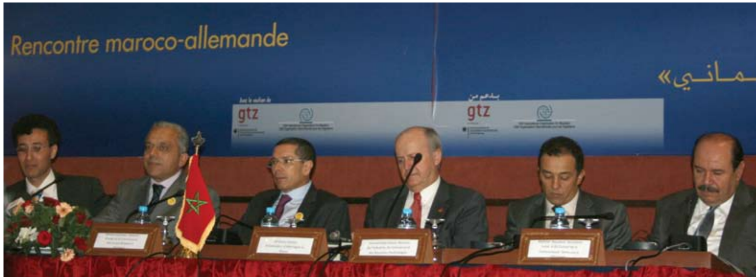
Ein hochrangiger Empfang auf der 1. Herbstuniversität der marokkanischen Kompetenzen in Deutschland in Fes

tente und vertrauenswürdige Ansprech- und Kooperationspartner in Marokko zu finden. Dies könnte zum einen daran liegen, dass die Projekte der Migranten zu hohe Anforderungen für potenzielle Partner in Marokko darstellen. Bezogen auf die Herkunftsländer der Migranten aus dem Mittelmeerraum und auf die Institutionen aus dem Bereich der EZ könnten die institutionellen Akteure aus dem Herkunftsland die aktiven Migranten dabei unterstützen, adäquate Ansprechpartner im Herkunftsland zu finden. Das setzt voraus, dass die institutionellen Akteure in der EZ ein Verzeichnis anlegen, das für verschiedene Sektoren Ansprechpartner im Herkunftsland bereithält, und eine hohe Bekanntheit für die Migranten erlangen müssten, um als Ansprechpartner aus der Sicht der Migranten wahrgenommen zu werden. Dadurch könnten transnationale Netzwerke zwischen dem europäischen Aufnahmeland und den Herkunftsländern gebildet und institutionalisiert werden, welche zukünftig über die Realisierung von Projekten hinaus dauerhafte und nachhaltige Kooperationen in der EZ initiieren könnten. Die Informationslage der engagierten Migranten gilt es ebenfalls zu verbessern, indem der Zugang zu Informationen über die Interessenslagen der Landsleute im Herkunftsland, die Projektbedingungen und -anforderungen vor Ort verbessert werden. Auf diese Weise könnten sich die Migranten im Vorfeld über den