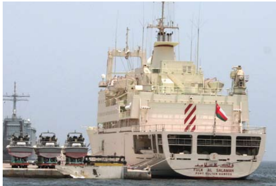
Der Hafen von Sohar - Standort der Flüssiggasproduktion im Golf

sieht. Zum anderen sollen aber auch industrielle Großprojekte umgesetzt werden, die Erdgas als Energiequelle nutzen. So bestehen derzeit mehrere Industrieparks, die weitestgehend lokale Rohmaterialien verarbeiten. Von zentraler Bedeutung sind weiterhin die Rohölproduktion und Raffinierung sowie die Natur- und Flüssiggasproduktion, etwa im Hafen von Sohar. Darüber hinaus gewinnen Industrien in den Bereichen Zement, Kupfer, Stahl, Chemie und Fieberoptik an Bedeutung.