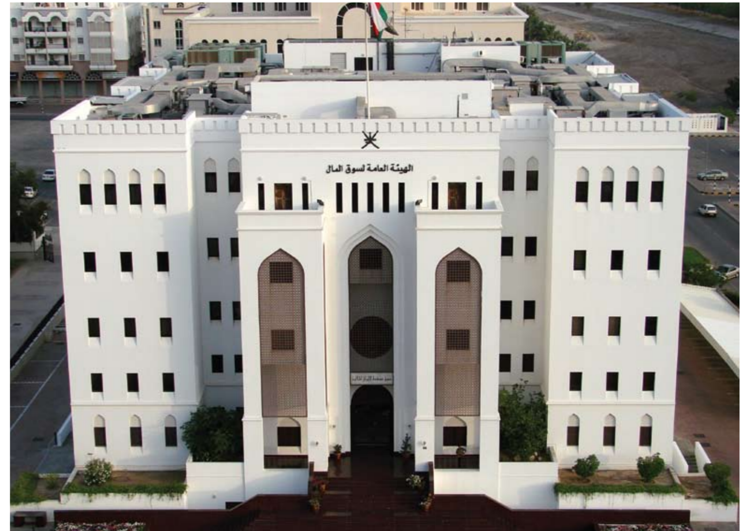
Die Börse in Muskat spiegelt die positive Wirtschaftsentwicklung wider

Wirtschaftlich gesehen ist der Oman auf dem Weg sich von der Abhängigkeit von erdöl- und erdgasbasierenden Sektoren zu lösen und die Wirtschaftsstruktur des Landes einer umfassenden Diversifikation zu unterziehen. Ambitioniertes staatliches Ziel ist es bis 2020 den Anteil am BIP Omans von Erdöl- und Erdgasindustrie auf insgesamt nur noch 9% zu senken. Um ausländische Investoren und deren Kapital anzuziehen unternimmt Oman verstärkte Anstrengungen in Form von Abkommen und der Umgestaltung der wirtschaftlichen Rahmenbedingungen. Auch in Zukunft sollen weitere