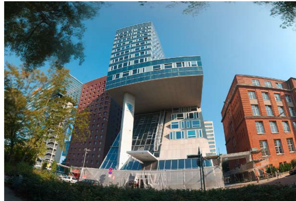
Hochschule für Angewandte Wissenschaften, Hamburg

PROF. LABERENZ: Wir sind insgesamt noch nicht so ganz glücklich mit der Anzahl der ausländischen Studierenden. Ein deutschlandweites Phänomen ist, dass die Zahl der ausländischen Studierenden rückläufig ist. Und zwar speziell der Bildungsausländer und Nicht-EU-Ausländer. Das entspricht überhaupt nicht unseren Wünschen: Wir liegen zurzeit unter 10% Bildungsausländer und wir streben 15% an. Hier zeigt sich die große Diskrepanz zwischen Wunsch und Wirklichkeit. Sicherlich könnte man die Zulassungskriterien anpassen, allerdings macht es wenig Sinn, Leute zuzulassen von denen völlig klar ist, sie schaffen es noch nicht, weil etwa die Sprachkenntnisse nicht vorhanden. Aber die Zahl der Bewerbungen ist auch relativ gering. Vor diesem Hintergrund haben wir beschlossen, unser Marketing im Ausland deutlich zu verstärken. Wir planen, Absolventinnen und Absolventen zu bitten als Botschafter für uns tätig zu werden. Ich glaube, wenn ein junger Marokkaner bei uns Ingenieurwissenschaften studieren will und der erste Kontakt über eine Homepage stattfindet und später Kontakttelefonate auf Deutsch geführt werden, dann kann das